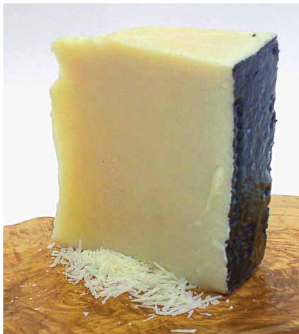
Pecorino – obožavan još od vremena staroga Rima

valja navesti one s nazivima graviera, formaella. Engleski tvrdi sirevi su cheshire, cheddar, leicester, škotski dunlop... Od naših, to su naravno paški sir, autohtoni hrvatski tvrdi sir, zatim bjelovarski ribanac, livanjski, lečevački itd.