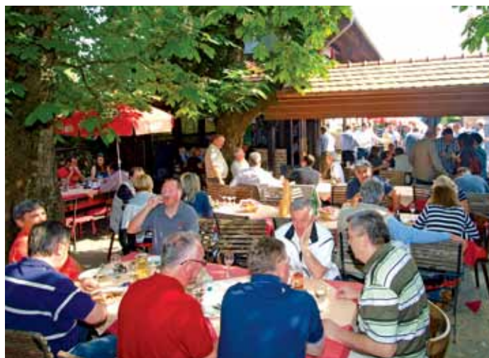
Fina papica i ugodnom ambijentu