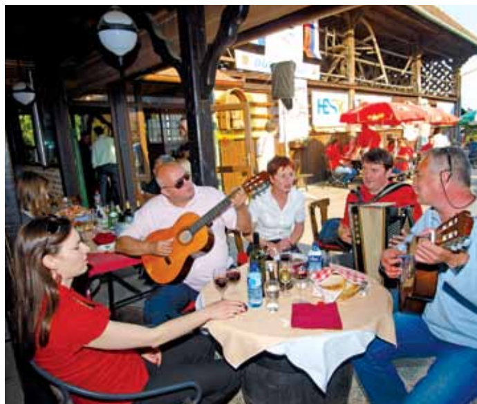
Veselje uz gitaru i harmoniku