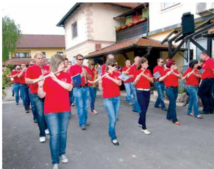
Svečanost je Počela mimohodom mažoretkinja