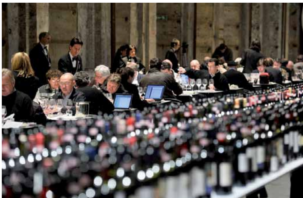
Impresivan prizor s degustacije chianti classica docg u Firenci: gotovo 200 novinara specijaliziranih za eno-gastronomiju iz cijeloga svijeta kuša vina apelacije chianti classico, a poslužuju ih sommelieri

današnjem toliko uspješnom brunellu iz Montalcina pak postavio je, također nekako u ono vrijeme, Ferruccio Biondi-Santi, iz jedne od i sada na svjetskoj razini najcjenjenijih vinskih kuća Il Greppo. On doduše nije bio političar, ali se kao vojnik on borio za ujedinjenje Italije, služio je u Garibaldijevoj vojsci, a kad se vratio doma najozbiljnije se posvetio vinogradarstvu i vinu, nastavljajući tako na najbolji mogući način inicijativu što ju je, s ciljem unaprjeđenja proizvodnje visokokvalitetnih vina u Montalcinu, bio dao njegov djed Clemente. Ferrucciov pak rad nastavio je sin mu Tancredi, koji 1926. u Montalcinu osniva PZ Il Greppo, i počinje izvoziti vino i u SAD... Najstarija boca brunella koja postoji čuva se baš na imanju il Greppo, a vino je iz berbe 1888.