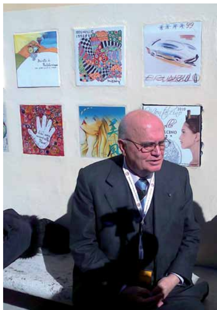
Ezio Rivella, predsjednik Konzorcija za brunello, Vitez je rada talijanske Republike od 1985., predsjednik je Nacionalnog ureda za vina doc, u njegove titule ubrajaju se i one predsjednika moćne grupacije Unione italiana vini, potpredsjednika OIV-a. Na slici je prigodom postavljanja na zid tornja u Montalcinu keramičke pločice s oznakom kakvoće berbe 2010

Brunello 2006 se na kušanju pokazao općenito gledano doista u odličnom izdanju i ta berba zaista potpuno zavrjeđuje svih pet zvjezdica dodijeljenih joj službeno kao ogledalo kakvoće. Berba 2010.