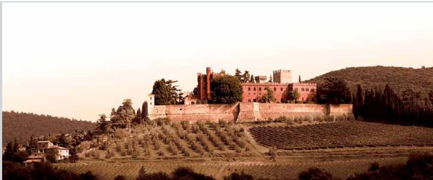
Castello di Brolio, povijesno zdanje, dvorac i vinogradarski posjed obitelji Ricasoli, kojime danas upravlja potomak Željeznog baruna Francesco Ricasoli