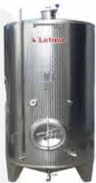
TIP Z zatvoreni spremnik