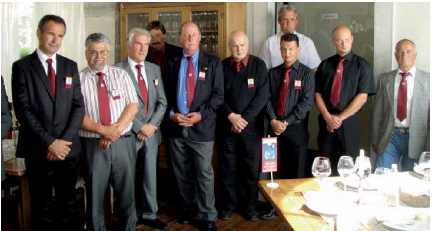
Kraški vinari članovi Konzorcija na susretu s novinarima nakon degustacije

Događaj doista na vrlo visokom nivou, marketinški dobro usmjeren. Unatrag nekoliko godina domaćini redovito pozovu i reviju Svijet u čaši , koja za ovo posljednje događanje može reći da je ponudilo, u kompletu, dosad najbolje konzorcijske Kraške terane , i dosad i najbolju hranu. Da, Konzorcijske