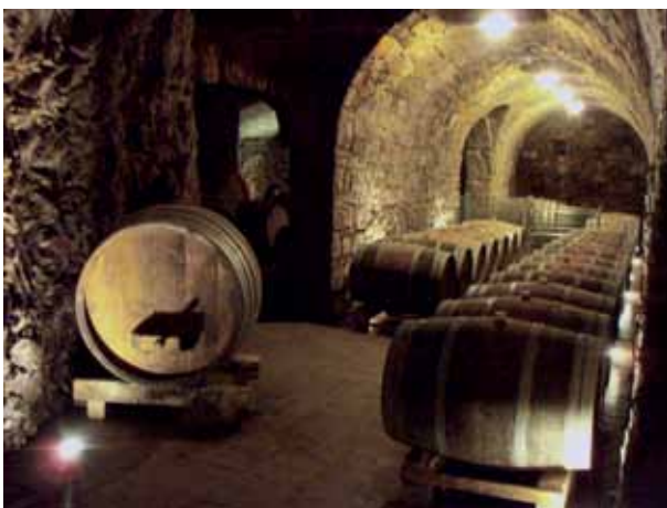
Podrum Benjamina Zidaricha, također ukopan u stijeni, te s prigušenim ovjetljenjem i s novim bačvama poput eksponata izgleda kao kakva galerija odnosno etno-muzej vinarstva