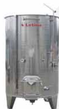
TIP PZPK spremnik za zračnim poklopcem