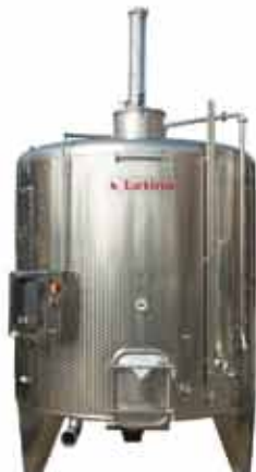
TIP VIP vinifikator romat