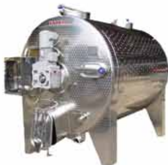
TIP VIN vinifikator vinimatik