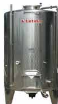
TIP VIK vinifikator