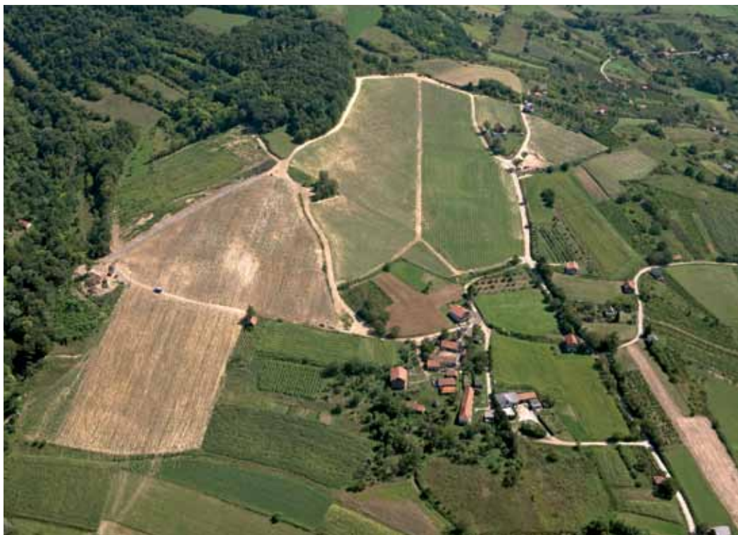
Posjed poduzetnika Stjepana Šafrana u Brezničkom Humu: vinarija na vrhu brežuljka, stambena zgrada dolje, ambijent sav u zelenilu, djeluje poput parka