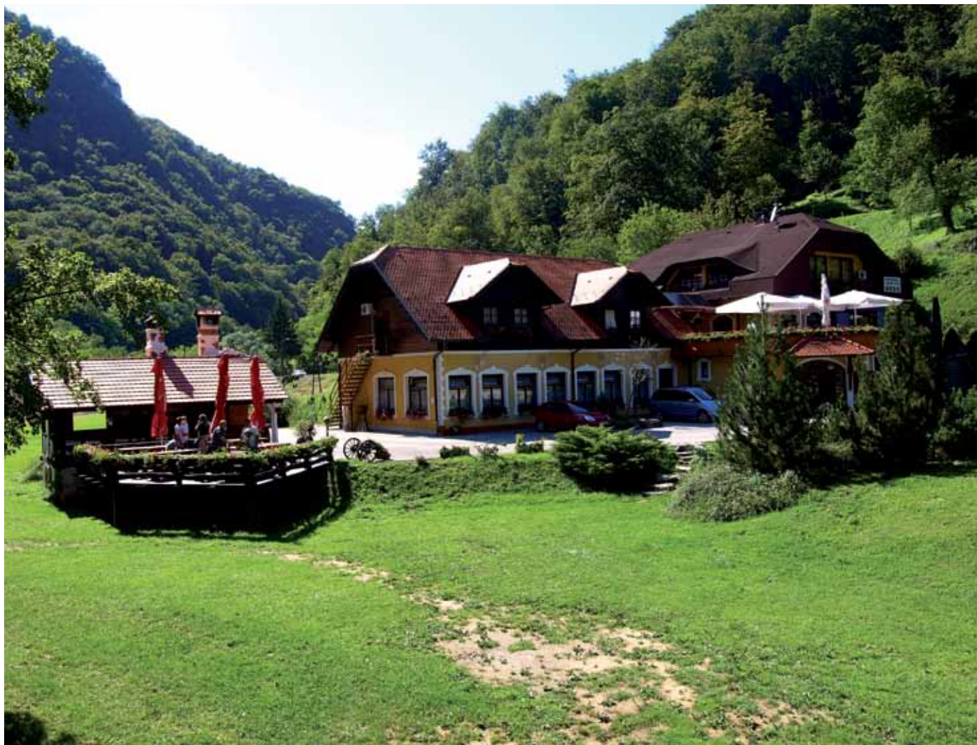
Lijepo uređeno izletište-prenočište Zelenjak pored spomenika himni Lijepa naša

PÒJD'MO V KAJKAVSKI KRAJ! BÚ LIJEPE! IPAK, ZAPRÀV, i V STVÀRNOSTI TAJ KOTIČEK LEPE NAŠE Z VRÈDENOSTIMA AMBIJENTA i KULTURNO-POVIJESNIH SPOMENIKA, V SAKEM SLUČĀJU DVÒRCIH, PA i Z VINOM i Z GASTRONOMIJOM, MORA BLISTĀTI ÒNAK KAK ZDAJ BLISTA F TURISTIČKIM PROSPEKTIMA TERIMA SE REKLAMIÈRA