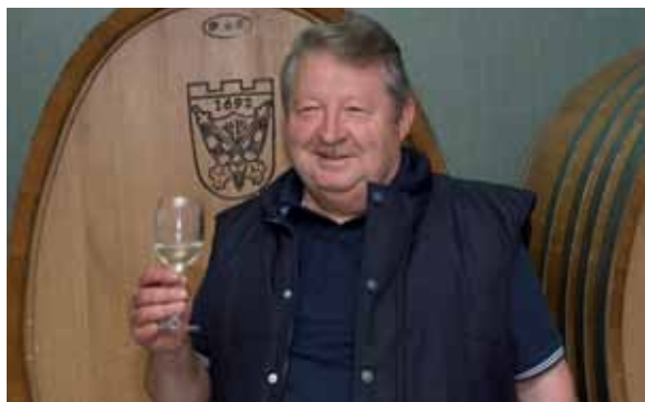
Šafran u novom podrumu opremljenom i s nekoliko velikih drvenih bačava

Sjedište vinske kuće Šafran nalazi se u neposrednoj blizini izlaza s autoceste Zagreb-Varaždin za Breznički Hum. Objekt posjeduje i veliku kušaonicu koja se po potrebi pretvara u restoran (pored se nalazi kuhinja), i sasvim sigurno vrlo je važna točka na vinskoj cesti Hrvatskim zagorjem.