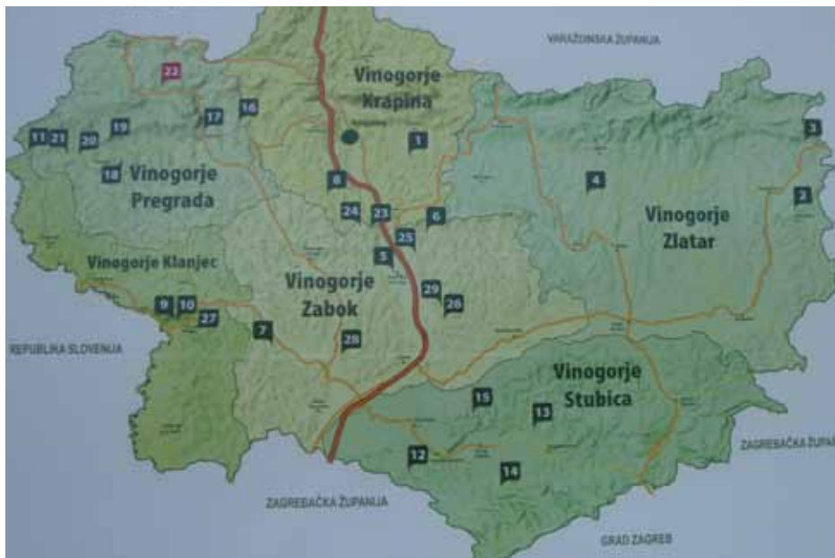
Teritorij Hrvatskog zagorja i njegova vinogorja

tržišne proizvodnje plemenite kapljice pa i (kvalitetnijeg) turizma duboko spavalo, da bi se oko vina unatrag desetak godina stvari počele mijenjati, i sad tamo postoje tri i te kako relevantna proizvođača kapljice, dva već afirmirana i u međunarodnim okvirima. Napokon se - dosta vremena nakon odlaska iz Klanjca agilne turističke djelatnice Lidije Jambrešić koja je mnogo učinila na popularizaciji Klanjca, Tuheljskih Toplica i Kumrovca te narodnih običaja i domaćih jela toga područja, i dugo nakon odlaska neumornog Rude Ivančića iz Zaboka – eto jače počelo uvažavati lijepe mogućnosti regije i za turizam. Šteta ih je, dakako, ne nastojati maksimalno iskoristiti, to više što Zagreb kao veliki potencijalni emitivni centar nije daleko, a u susjedstvu su Slovenija i Austrija stanovnike kojih i te kako zanimaju sadržaji što ih Hrvatsko zagorje može izvući kao adute iz rukava.