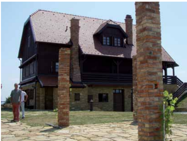
Na hrptu brda ponad Hraščine: tradicijska drvena kuća posjeda Vinski vrh, s lijepo uređenim restoranom i gostinjskim sobama

samo san - 20 hektara vinograda s oko 100.000 trsova! Moguće je da će se još malo i širiti, veli, najviše za pet hektara, izgledi za kupnju kvalitetnih parcela postoje... Bolfan uzgaja svjetski cijenjene sorte, primjerice Rizling rajnski, Sauvignon bijeli, Pinot sivi, Traminac, Muškat žuti, te od bijelih i nešto Graševine i Rizvanca, a od crnih Pinot crni, Cabernet sauvignon, nešto Frankovke. Količinski najviše je Sauvignona, Rizlinga i