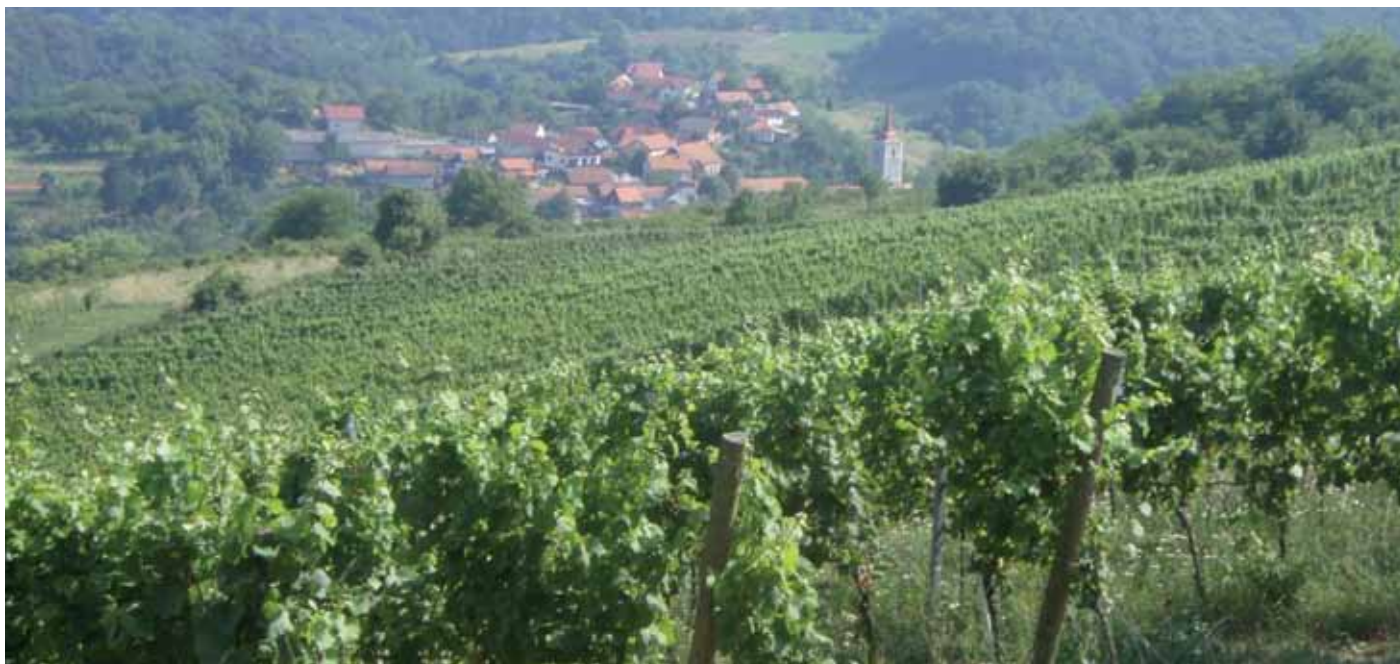
Pogled s Vinskog vrha prema dolje, preko trsja, na selo Hraščina

ČESTITAMO Vetropack Straži 150. obljetnicu!