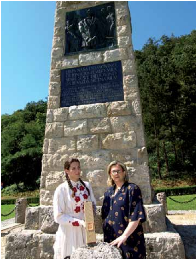
Zastanite i vi! Spomenik himni Lijepa naša u Zelenjaku, između Klanjca i Kumrovca