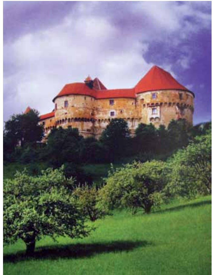
Dvorci i perivoji obilježja su Hrvatskog zagorja. Koliko ih je uređeno i u kojoj su mjeri adekvatno uređeni i sa sadržajima?